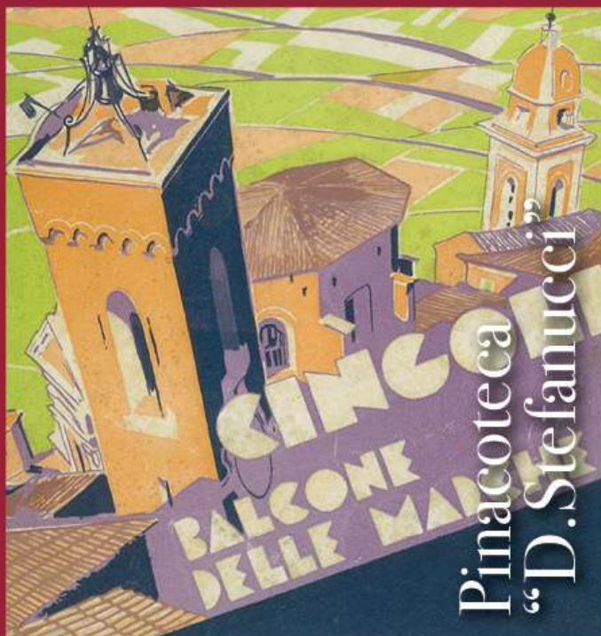
Pinacoteca "D. Stefanucci"