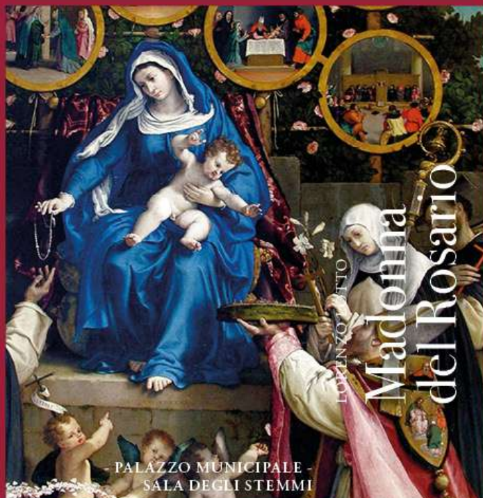
Madonna del Rosario