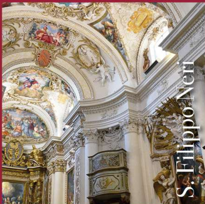
S. Filippo Neri